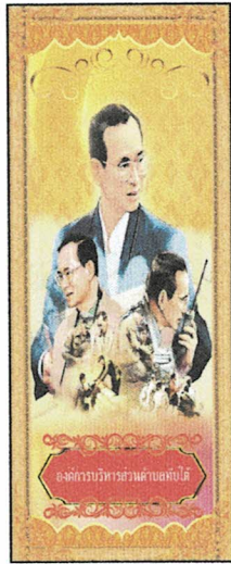
แบบที่ ๑ จำนวน ๙ ชุด (หน้า- หลัง)